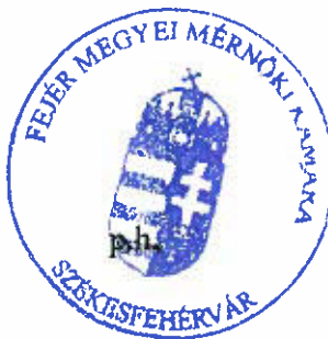
Kumánovics György titkár