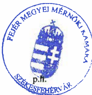
Kumánovics György titkár